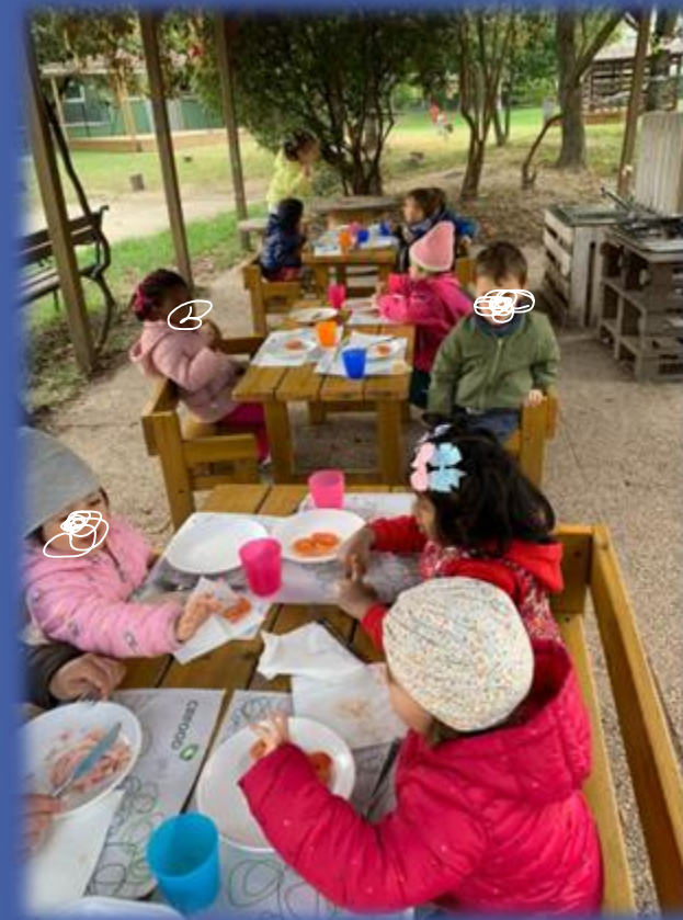
Pranzo in outdoor