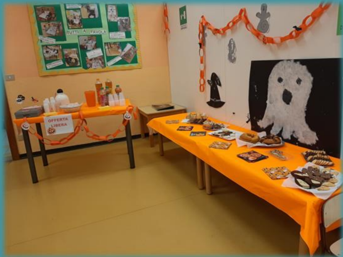
Le colazioni a scuola