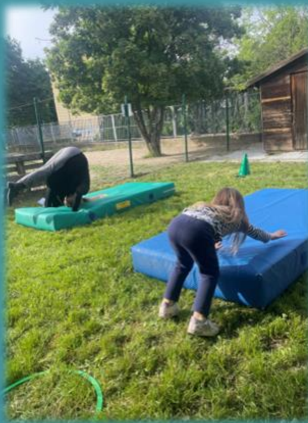
La nostra festa della famiglia