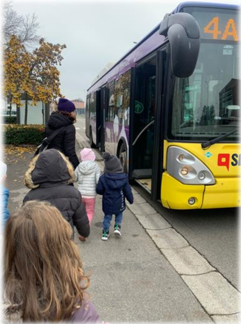
USCITA CON I MEZZI DI TRASPORTO AL PALAZZO DEI MUSEI DI MODENA