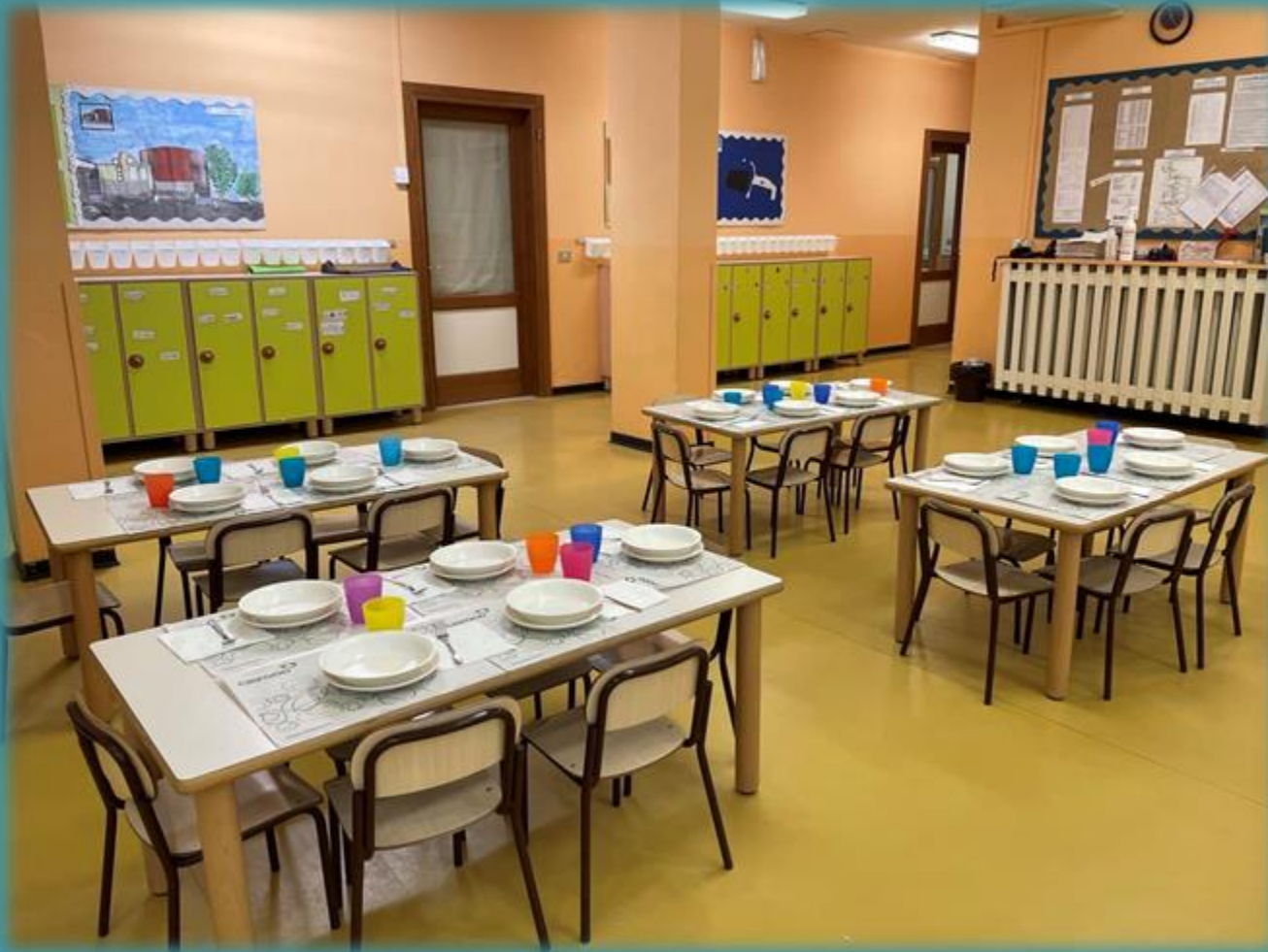
I tavoli del pranzo delle sezioni dei 3 e 4 anni