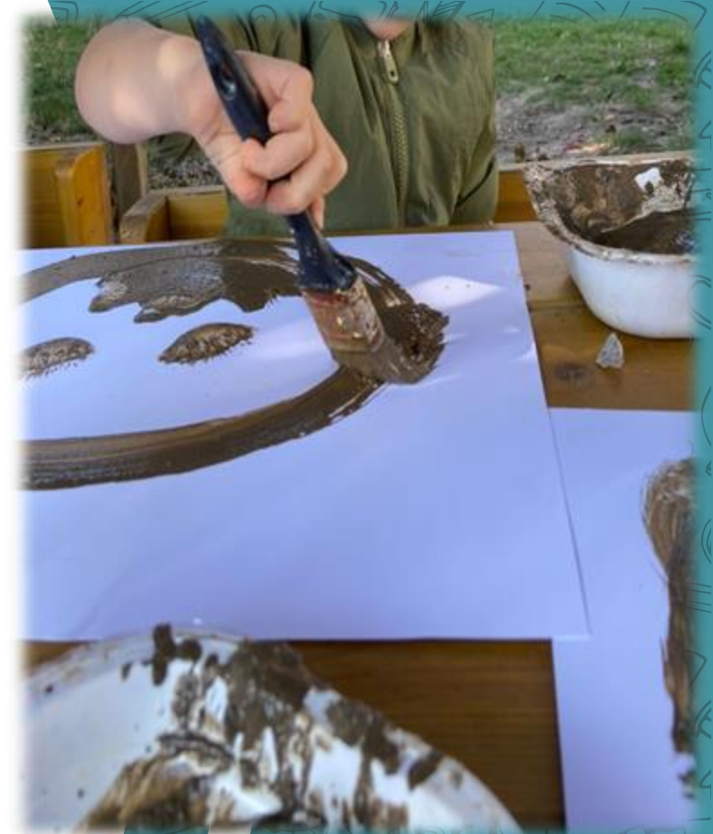
LABORATORI IN OUTDOOR "LE FACCE DI FANGO" PROGETTO "DAL VISO AL CORPO"