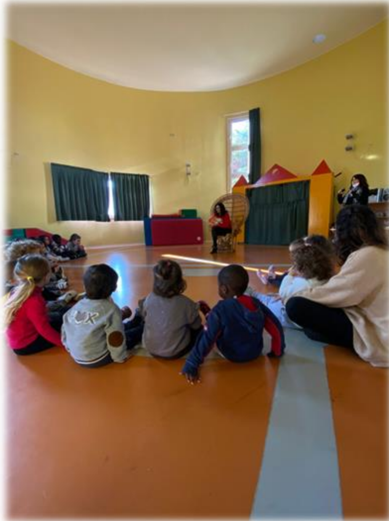
LETTURE DI NATALE IN PALESTRA ORGANIZZATE DAI GENITORI