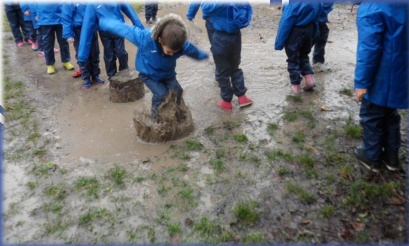
Tute per l'outdoor